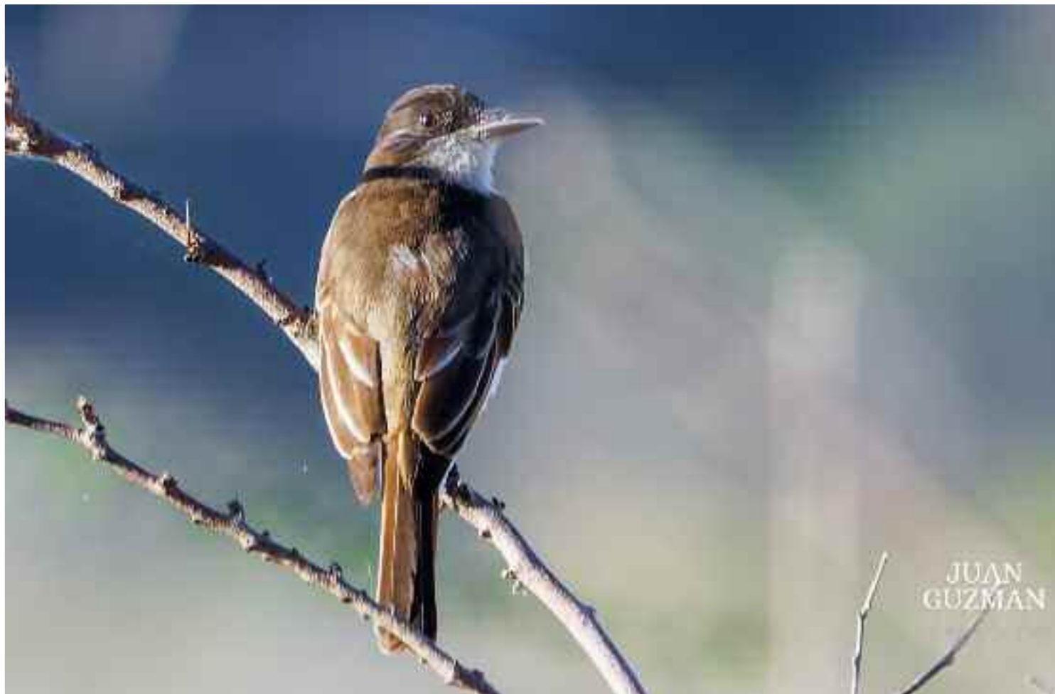
FOTO EN EL CAMINO Majuila en La Furnia

M ajuila ( Tyrannus caudifasciatus ) (La subespecie gabbir es endémica de la Hispaniola). Una especie de ave paseriforme de la familia Tyrannidae perteneciente al género Tyrannus . Es nativo de las Antillas Mayores. La especie T. caudifasciatus fue descrita por primera vez por el naturalista francés Alcide d'Orbigny en 1839.