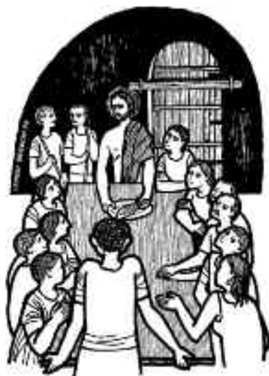
Les abrió el entendimiento para comprender las Escrituras.

Experimentando a Cristo resucitado, los discípulos comprenden el proyecto de Dios en la muerte del Mesías: matar a la muerte, y vivificar a todos los que crean con la misma vida del resucitado.