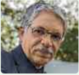
TEXTO Y FOTO: Juan Guzmán